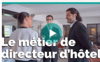
Le métier de directeur d'hôtel