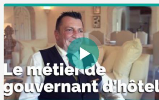
Le métier de gouvernant d'hôtel