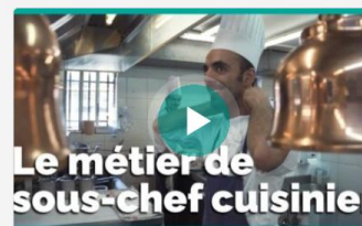
Le métier de chef cuisinier